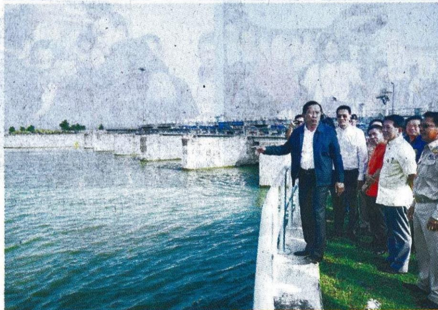
รมว.เกษตรฯตรวจเยี่ยมเขื่อนลำตะคอง

"การวางระบบบริหารจัดการน้ำในพื้นที่ จ.นครราชสีมา จะมีการบริหารจัดการน้ำในส่วนของน้ำในอ่างเก็บน้ำ และน้ำในส่วนปริมาณน้ำฝนที่จะไหลลงมาในลำน้ำหลัก ซึ่งจะใช้อาคารเป็นตัวกักเก็บน้ำ ตัวบังคับน้ำและจัดการจราจรน้ำ โดยเฉพาะในกลุ่มน้ำลำเชียงไกรเป็นกลุ่มน้ำที่เคยมีปัญหา น้ำท่วมและน้ำแล้งซ้ำซาก โดย พล.อ.ประยุทธ์ จันทร์โอชา นายกรัฐมนตรี ครั้งเดินทางมาตรวจราชการเมื่อวันที่ 25 พฤษภาคม