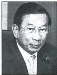
พล.อ.ฉัตรชัย สาริกัลยะ

พล.อ.ฉัตรชัย สาริกัลยะ รัฐมนตรีและ สหกรณ์ เปิดเผยว่า สถานการณ์น้ำใน อ่างเก็บน้ำขนาดใหญ่ทั่วประเทศ 34 แห่ง ณ วันที่ 28 กุมภาพันธ์ มีปริมาณน้ำ อยู่ในเกณฑ์ดีมาก ขณะที่ปริมาณน้ำใช้ การได้ในปีนี้ 21,019 ล้านลูกบาศก์เมตร (ลบ.ม.) มากกว่าปี 2559 รวม 7,984 ล้าน ลบ.ม. ขณะที่เมื่อรวมกับเขื่อน ขนาดกลางอื่นๆ ทั้งประเทศ จะมีปริมาณ น้ำรวม 47,483 ล้าน ลบ.ม. คิดเป็น ร้อยละ 63 ของความจุ และมีปริมาณน้ำใช้ การได้ 23,663 ล้าน ลบ.ม. คิดเป็น ร้อยละ 46 มากกว่าปี 2559 รวม 8,762 ล้าน ลบ.ม.