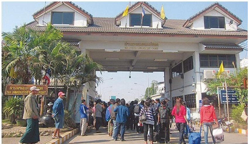
แต่ละวันผู้คนข้ามประเทศเนืองแน่น

คิดเห็นของผู้มีส่วนได้เสีย ซึ่งประกอบด้วยเกษตรกรผู้ผลิตสินค้าเกษตรที่สำคัญในระดับพื้นที่ เจ้าหน้าที่หน่วยงานภาครัฐ ภาคเอกชน ผู้