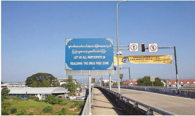
สะพานไทย-เมียนมา

ล้านบาท ซึ่งการนำเข้าสินค้าจะดำเนินการแบบมีข้อตกลงซื้อขายระหว่างกันของผู้ซื้อและผู้ขาย โดยร้อยละ 70 นำเข้าและส่งออกผ่านสะพานมิตรภาพไทย-เมียนมา ซึ่งเป็นไปตามนโยบายด้านการส่งเสริมการค้าชายแดนของทั้งสองประเทศ