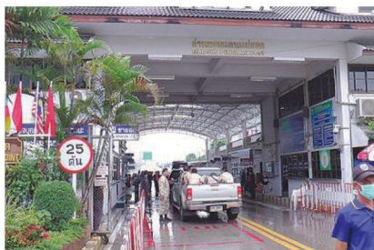
ชายแดนฝั่งไทย

ของทุกปี เพื่อไม่ให้ส่งผลกระทบต่อเกษตรกรภายในประเทศ โดยปริมาณการนำเข้าขึ้นอยู่กับปริมาณการจัดสรรโควตาให้แก่สหกรณ์