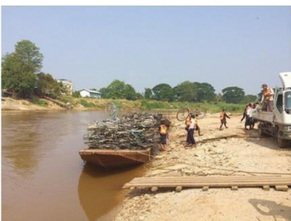
สินค้าขนส่งผ่านทางเรือ

ว่าจากการศึกษาถึงสถานการณ์การค้ารูปแบบการบริหารจัดการด้านการนำเข้า-ส่งออกสินค้าเกษตรของสหกรณ์การเกษตรในพื้นที่ ความ