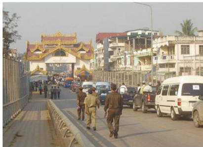
เข้าสู่ฝั่งเมียนมา

สำหรับรูปแบบการบริหารจัดการด้านการนำเข้า และส่งออกสินค้าเกษตรของสหกรณ์การเกษตรในพื้นที่ พบว่า มีสหกรณ์การเกษตรที่ดำเนินธุรกิจการค้ากับประเทศเมียนมา 4 สหกรณ์ ได้แก่ สหกรณ์นิคมแม่สอด จำกัด สหกรณ์นิคมแม่ระมาด จำกัด สหกรณ์การเกษตรแม่ระมาด จำกัด และสหกรณ์การเกษตรพบพระ จำกัด ตามนโยบายของรัฐบาลด้านการส่งเสริมการค้าชายแดนที่มีกรมส่งเสริมสหกรณ์เป็นหน่วยงานรับผิดชอบหลักภายใต้กรอบ AFTA ซึ่งอนุญาตให้นำเข้าผลผลิตได้ในช่วง 1 กุมภาพันธ์ถึง 31 สิงหาคม