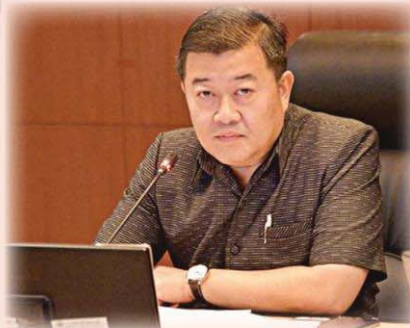
อธิบดีกรมส่งเสริมสหกรณ์

“จากการติดตามสถานการณ์ในสหกรณ์อ้อมทรัพย์จุฬาลงกรณ์ฯ ขณะนี้ ยังคงสามารถดำเนินงานได้ตามปกติ อาจจะมีสมาชิกสหกรณ์บางส่วนเดินทางเข้ามาสอบถามข้อมูลที่สหกรณ์และมีความห่วงใยในสถานการณ์ที่เกิดขึ้น แต่ส่วนใหญ่ก็เข้าใจและรับทราบข้อเท็จจริงว่าสหกรณ์ไม่ได้เข้าไปมีส่วนเกี่ยวข้องและไม่ได้ส่งผลกระทบใด ๆ กับการดำเนินงานของสหกรณ์ สมาชิกจึงยังคงดำเนินธุรกรรมทางการเงินกับสหกรณ์เหมือนช่วงที่ผ่านมา และยังไม่มีความวิตกกังวล