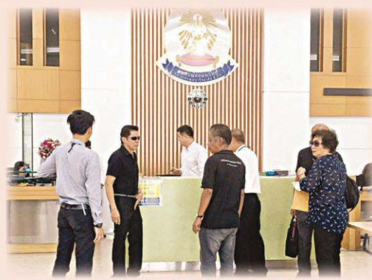
สมาชิกยังเชื่อมั่นในสหกรณ์ฯ