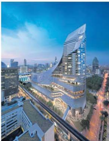
A perspective of Park Hyatt Bangkok.

THURSDAY: Electricity Generating Authority of Thailand, Impact Exhibition Management Co and MEX Exhibitions Co are jointly organising LED Expo Thailand, Asean's largest international exhibition on LED lighting products and technology at Challenger 1, Impact Muang Thong Thani. The event, which ends on Saturday, is a venue for LED and lighting companies to gather, promote, discuss, transact, partner and gain insights on neighbouring LED markets.