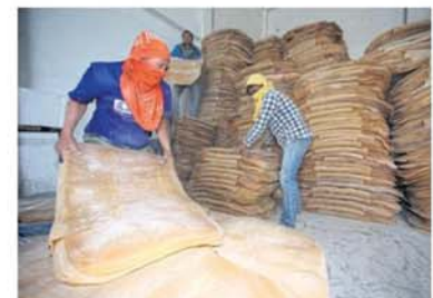
Workers unload rubber sheets in Buri Ram.

→ THURSDAY: Sri Trang Agro Industry, a fully integrated natural