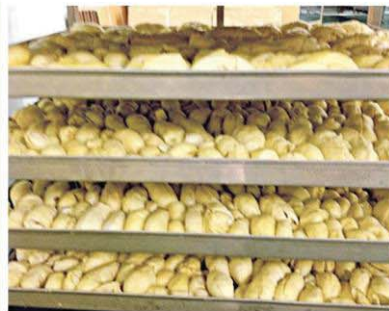
ทุเรียนแช่แข็งตลาดต้องการมาก