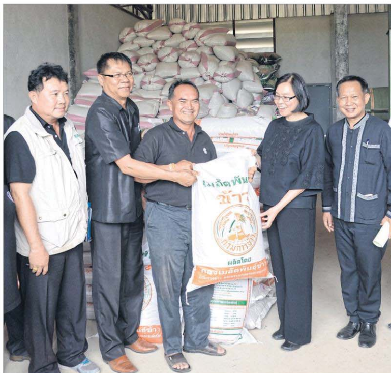
ชัยภูมิโมเดล : ชูติมา บุญยประภัสร์ รมช.เกษตรและสหกรณ์ ลงพื้นที่ตรวจเยี่ยมชมฐานเรียนรู้การผลิตปุ๋ยอินทรีย์ของเกษตรกรแปลงใหญ่ข้าว ภายในศูนย์เรียนรู้การเพิ่มประสิทธิภาพการผลิตสินค้าเกษตร (ศพก.) ต.ศรีสำราญ อ.คอนสวรรค์ จ.ชัยภูมิ เพื่อติดตามการดำเนินงานตามแผนการผลิตและการตลาดข้าวครบวงจร และแผนปฏิบัติงานเกษตรอินทรีย์