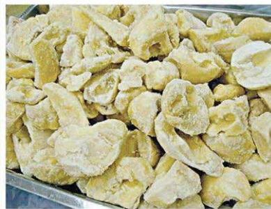
ทุเรียนแช่แข็งไม่มีปัญหาเรื่องทุเรียนอ่อน

สะอาด และสุขลักษณะส่วนบุคคล เป็นต้น นอกจากนี้ ยังมีข้อกำหนดในการควบคุมเชื้อโรคและสารเคมีที่อาจปนเปื้อนในผลิตภัณฑ์ และระบบควบคุมสุขลักษณะ เช่น การรับวัตถุดิบทุเรียนที่มีคุณภาพและปลอดภัย การควบคุมกระบวนการแช่เยือกแข็ง เก็บรักษาและขนส่ง เพื่อให้ผลิตภัณฑ์มีอุณหภูมิที่ 18 องศาเซลเซียสหรือต่ำกว่า รวมถึงการจัดการและการกำกับดูแลเฝ้าระวังอันตรายต่าง ๆ ที่เกิดขึ้นกับผลิตภัณฑ์ด้วย