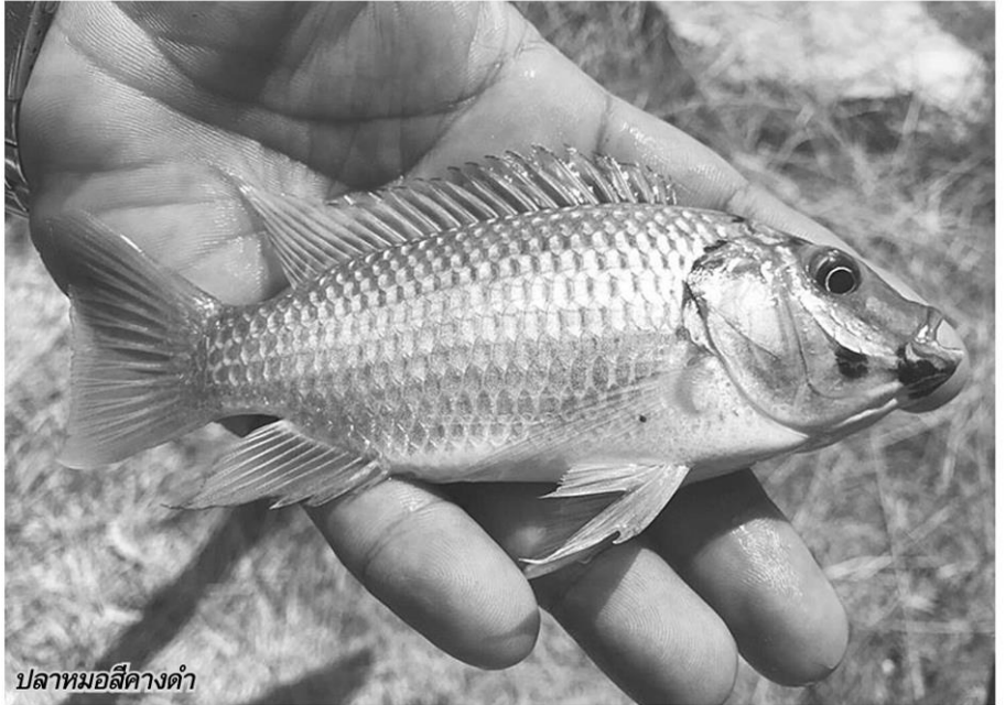
ปลาหมอสีคางดำ

2.กรมประมงได้เตรียมปล่อยปลากะพงขาวลงแหล่งน้ำ เพื่อตัดวงจรการแพร่ขยายพันธุ์ปลาหมอสีคางดำ ส่วนเหตุผลที่กรมประมงไม่ปล่อยลงแหล่งน้ำทันที เนื่องจากปลากะพงขาวเป็นปลา