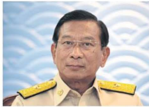
พล.อ.ฉัตรชัย สาริกัลยะ

อย่างไรก็ตาม กระทรวงเกษตรฯ จะเสนอมาตรการช่วยเหลือเป็นแบบชดเนื่องจากพื้นที่ข้าวหากเสียหายก็จะส่งเสริมให้ปลูกพืชอื่นเนื่องจากระยะเวลาที่เหลือจะไม่เหมาะกับการปลูกข้าวคุณภาพดีที่ต้องปลูก 120 วัน ซึ่งจะส่งผลต่อคุณภาพ