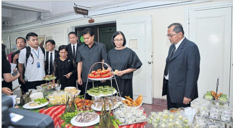
ของดีชายแดนใต้ : ชุดิมา บุญยประภัสร์ รมช.เกษตรและสหกรณ์ เป็นประธานแถลงข่าวการจัดงาน “ของดีชายแดนใต้ ครั้งที่ 10” เพื่อเผยแพร่ผลงานการพัฒนาอาชีพการเกษตรที่สามารถขยายผล และเป็นที่ยอมรับของเกษตรกรในจังหวัดชายแดนภาคใต้ ซึ่งจัดขึ้นระหว่างวันที่ 25 ส.ค.-3 ก.ย. 2560 ณ ตลาด อ.ต.ก.เขตจตุจักร กรุงเทพฯ