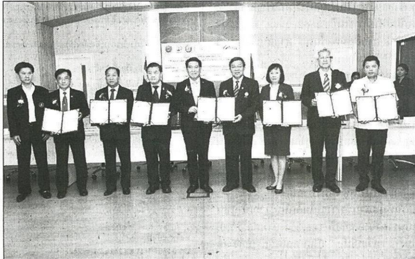
บริหารพื้นที่เกษตร : นายเลิศวิโรจน์ โกวัฒนะ ปลัดกระทรวงเกษตรฯ และ รศ.นพ.สรนิต ศิลธรรม ปลัดกระทรวงวิทยาศาสตร์ฯ เป็นประธานพิธีลงนามบันทึกข้อตกลงความร่วมมือการบริหารจัดการเกษตรเชิงพื้นที่โดยใช้เทคโนโลยีภูมิสารสนเทศของ 7 หน่วยงานในสังกัด เมื่อเร็วๆ นี้