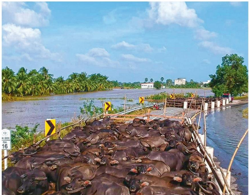
ช่วยควายน้ำ - สัตวแพทย์ ปศุสัตว์เขต 9 นำควายน้ำมากันคอกอยู่บนถนนเฉลิมพระเกียรติ 80 พรรษา 5 ธันวาคม 2550 หมู่ 1 บ้านห้วยป่า ต.บ้านขาว อ.ระโนด จ.สงขลา หลังถูกน้ำท่วมตายไปเกือบ 100 ตัว เนื่องจากอ่อนเพลีย ขาดแคลนหญ้าและว่ายน้ำมาไม่ถึงฝั่ง เมื่อวันที่ 8 ธันวาคม

ที่วิทยาลัยการสาธารณสุขสิรินธร ต.ควนธานี อ.กันตัง จ.ตรัง นายปรีดีปราโมทย์ เลิศ