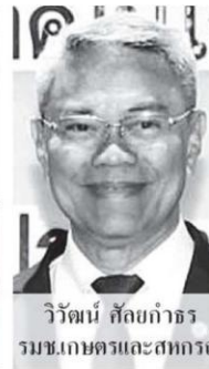
วิวัฒน์ สัตย์ถาวร รมช.เกษตรและสหกรณ์