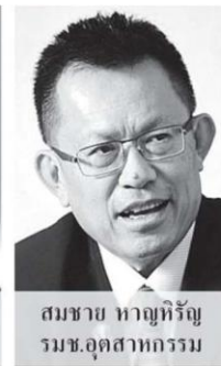
สมชาย หาญหิรัญ รมช.อุตสาหกรรม