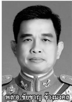
พล.อ.ชัยชาญ ช้างมงคล