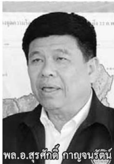
พล.อ.สุรศักดิ์ กาญจนรัตน์