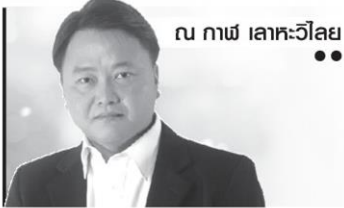
ณ นภาพ เลเคะวิลาย