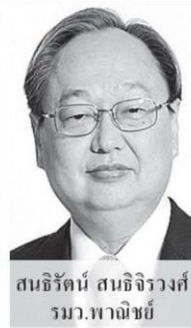
สนธิรัตน์ สนธิจิรวงศ์ รมว.พาณิชย์