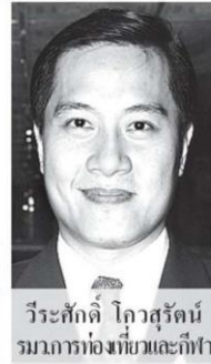
วีระศักดิ์ โควสุรัตน์ รมการท่องเที่ยวและกีฬา