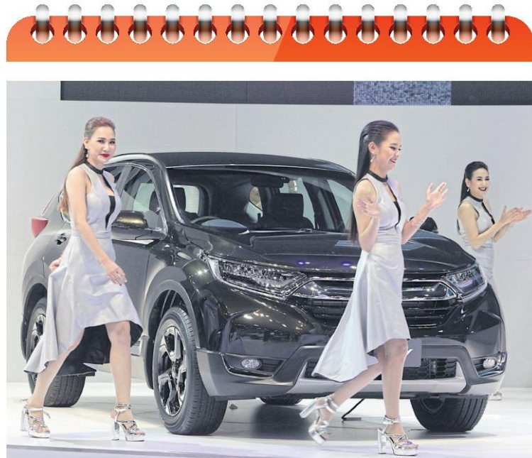
The Motor Expo starts on Thursday and runs through Dec 11.

→ TUESDAY: Deputy Prime Minister Somkid Jatusripitak presides over the 40th anniversary celebration of Thai Union Group Plc (TU), one of the world's seafood leaders. There will be an exhibition about Thai Union's 40-year history, its achievements and a special gala dinner under the theme "Rising to the Future" for 500 leading busi-