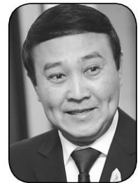
พล.อ.อุดมเดช สิตบุตร