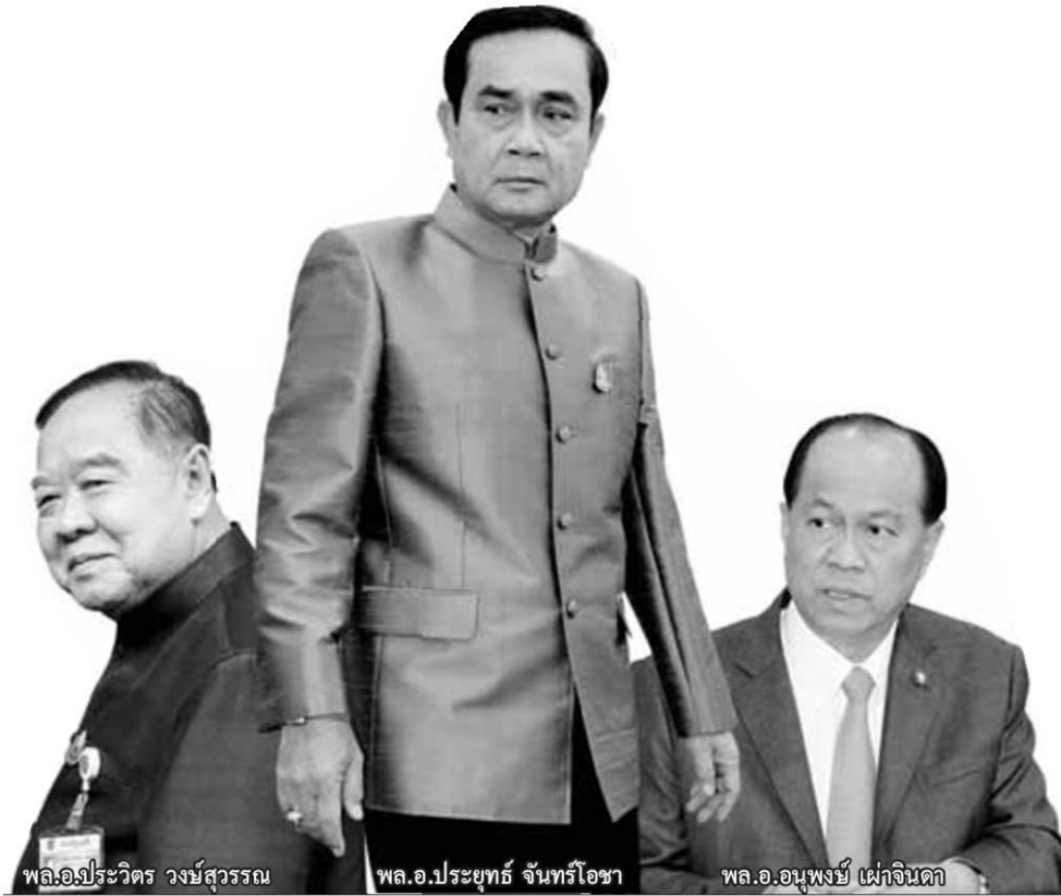
พล.อ.ประวิตร วงษ์สุวรรณ

คอลัมน์: ขยายปมร้อน: 'क्रम.ประยุทธ์5' ฟัน้องผองเพื่อน 'บิ๊กตู' ยังเหนียวแน่น!