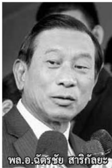
พล.อ.ฉัตรชัย สาริกัลยะ

ผู้ขายเครื่องตรวจจับสารวัตถุระเบิด จีที 200 ให้แก่กองทัพ ทั้งนี้การประกาศรายชื่อ "क्रम.ประยุทธ์ 5" เมื่อช่วงค่ำวันที่ 24 พฤศจิกายนนั้น ยังเป็นการแก้ไขปัญหาลเฉพาะหน้าและหวังลดบรยากาศต่อการประชุมครม.ภาคใต้ ระหว่างวันที่ 27-28 พฤศจิกายน ของพล.อ.ประยุทธ์ที่ จ.สงขลา ในช่วงราคายางพาราคงตัว หลังโยก พล.อ.ฉัตรชัย สาริกัลยะ รมว.เกษตรและสหกรณ์ มาขึ้นตำแหน่งรองนายกรัฐมนตรี ซึ่งคาดการณ์ว่าในการประชุม ครม.ภาคใต้ จะมีตัวแทนเกษตรกรสวนยางเข้ายื่นหนังสือต่อนายกรัฐมนตรี เพื่อเร่งแก้ไขปัญหาดังกล่าว รัฐมนตรีทหารอีกคนที่มีการขยับคือ "บิ๊กโย่ง" พล.อ.อนันตพร กาญจนรัตน์ ถูกโยกจากกระทรวงพลังงาน มาขึ้นกระทรวง