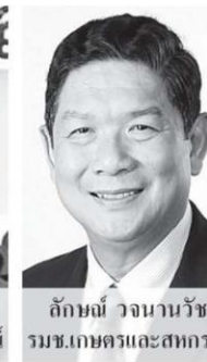
อัถนงษ์ วงนนวนัช รมช.เกษตรและสหกรณ์