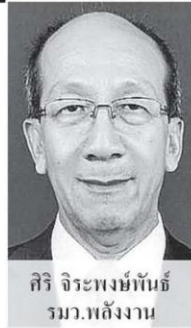
ศิริ จิระพงษ์พันธ์ รมว.พลังงาน