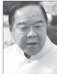
พล.อ.ประวิตร วงษ์สุวรรณ

ต่างจากศิษย์เก่านักเรียนเตรียมทหารรุ่นที่ 56 รายหนึ่ง ที่โปสต์ข้อความผ่านเฟซบุ๊ก Thatpon Srisupunbut ถึงกรณี “น้องเมย์” เตือนสติศิษย์เก่าและศิษย์ปัจจุบันของโรงเรียนเตรียมทหาร .. สกิดเตือนว่า ที่พี่น้อง ตท.ทำกันอยู่เข้าข่าย “คลังสถาบัน” รีบเล่า .. นำ “เกียรติยศ - ศักดิ์ศรี” มาข่ม “ศักดิ์ศรีของความเป็นมนุษย์” หรือไม่ .. พร้อมทั้งท้ายด้วยประโยคที่สะท้อนวุฒิภาวะสูงส่งกว่า “นายพล” ที่ใหญ่คับบ้านคับเมืองเสียอีก ว่า “ไม่มีใครทำลายพวกเราได้ ยกเว้นพวกเราเอง” ..จน “ยอดไลค์-ยอดแชร์” กระหน่ำเหมือนเป็นการเหยียบเข้าที่หน้าของผู้ที่หมิ่นศักดิ์ศรี “น้องเมย์” ก่อนหน้านั้นทุกคน .. และถามต่อว่า เมื่อไหร่ “สังคมไทย” จะพอใจ ก็ตอบแทนได้เลยว่า “ต้องมีคนรับผิดชอบ” ดูอย่างทีประเทศพัฒนาแล้ว อย่าง “เกาหลีใต้” ที่นั่นศาลทหารตัดสินลงโทษจำคุกนายทหารยศสิบเอก 40-50 ปี ที่เป็น “หัวโจก” ชักชวนเพื่อนทหารให้ข่มเหงรังแก “ทหารเกณฑ์” จนเสียชีวิต .. ถ้าจบแบบนี้มันก็จะจบปีเอนดิง แล้วจะทำให้กองทัพกลับมาสร้างมุกอีกครั้ง.