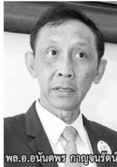
พล.อ.อนันตพร กาญจนรัตน์