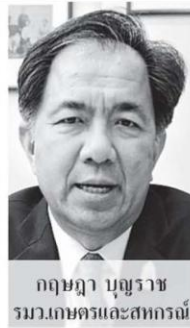
กฤษฎา บุญราช รมว.เกษตรและสหกรณ์