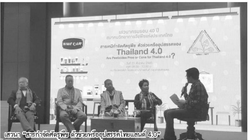
เสวนา “สารกำจัดศัตรูพืช (ตัวช่วยหรืออุปสรรคไทยแลนด์ 4.0)”