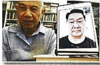
'ปรีดียาธร'แนะรัฐตั้ง ผู้เชี่ยวชาญแก้สินค้าเกษตร 16