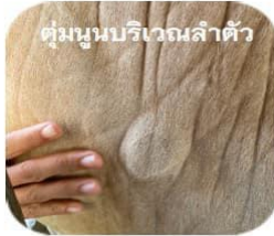
ตุ่มนูนบริเวณลำตัว