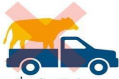
งดเคลื่อนย้ายสัตว์ป่วย