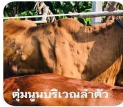
ตุ่มนูนบริเวณลำตัว