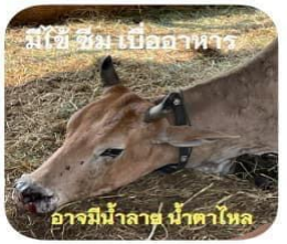
มีไข้ ซึม เบื่ออาหาร