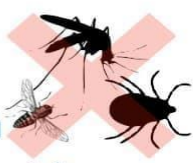
กำจัดพาหะ