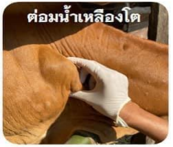
ต่อมเหงื่อเหือดแห้ง