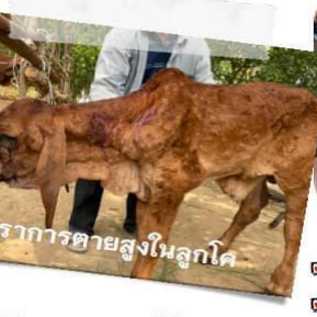
อัตราการตายสูงในลูกโค