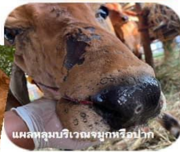
แผลหลุมบริเวณจมูกหรือปาก