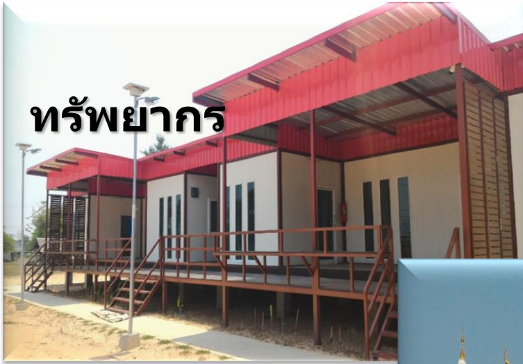
ทรัพยากร