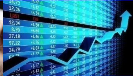
การลงทุน