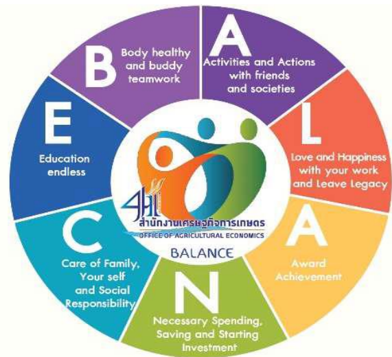
ภาพที่ 1 วัฒนธรรมการปฏิบัติงานที่มีความสมดุล (BALANCE) เป็นแนวทางในการปฏิบัติงาน