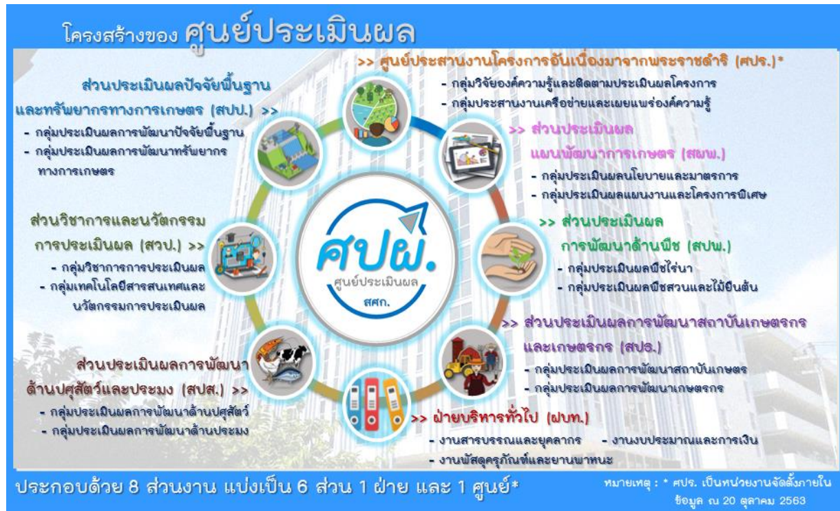
ภาพที่ 2 โครงสร้างของศูนย์ประเมินผล

การจัดแบ่งโครงสร้างภายในของศูนย์ประเมินผล ประกอบด้วย 6 ส่วน 1 ศูนย์ฯ 1 ฝ่าย ดังนี้