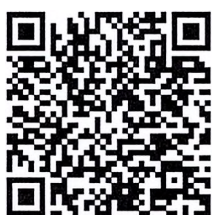
แบบรายงานผลการประเมินองค์การคุณธรรม ประจำปีงบประมาณ พ.ศ. ๒๕๖๗

ลนค. กล่าวว่า ประเด็นใดที่ยังไม่มีข้อมูล มอบส่วนพัฒนาทรัพยากรบุคคล ทหรือ ลนค. และให้แต่ละหน่วยงานประเมินตามข้อเท็จจริง และประเมินให้ครบถ้วน ถ้าหน่วยงานใดไม่ประเมินหรือประเมินไม่ครบถ้วน ต้องแจ้งให้ที่ประชุมผู้บริหารทราบ เพื่อจะได้สั่งการให้หน่วยงานนั้นดำเนินการ รวมถึง มอบส่วนพัฒนาทรัพยากรบุคคล เป็นเจ้าภาพหลัก และตรวจสอบว่ามีกิจกรรมใดที่หายไปบ้าง พร้อมทั้งดำเนินการตามกรอบเวลาที่กำหนด