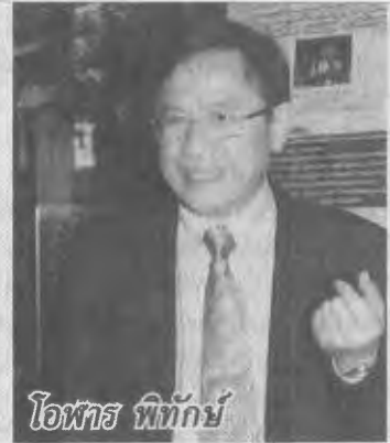
โอภาส พิทักษ์

พืชผัก 0.35 ล้านไร่ (ในเขตชลประทาน 0.05 ล้านไร่ และนอกเขตชลประทาน 0.30 ล้านไร่)