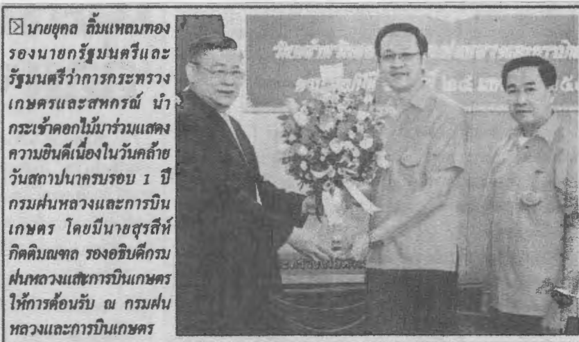
☒ นายชุกตม์ เต็มเหลมทอง รองนายกรัฐมนตรีและรัฐมนตรีว่าการกระทรวงเกษตรและสหกรณ์ นำกระเช้าดอกไม้มาร่วมแสดงความยินดีเนื่องในวันคล้ายวันสถาปนาครบรอบ 1 ปี กรมส่งเสริมการค้าระหว่างประเทศ โดยมีนายสุรสีห์ กิตติมณฑล รองอธิบดีกรมส่งเสริมการค้าระหว่างประเทศ ให้การต้อนรับ ณ กรมส่งเสริมการค้าระหว่างประเทศ