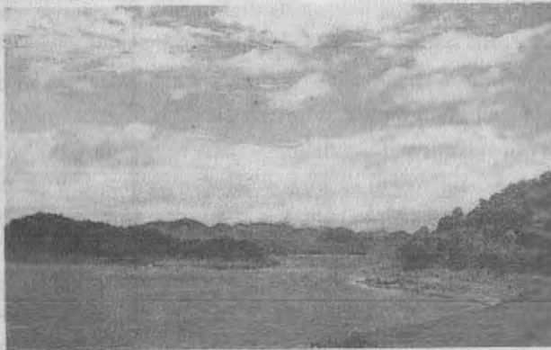
ดังนั้น ในช่วง ม.ค.-เม.ย.นี้ โครงการส่งน้ำและบำรุงรักษาเพชรบุรีได้วางแผนที่จะจัดสรรน้ำจากเขื่อนแก่งกระจานให้เกษตรกร

ขณะที่ภาคอื่นกำลังเจอภัยแล้ง แต่พื้นที่ 4 จังหวัดภาคใต้ตอนบน มีน้ำท่าอุดมสมบูรณ์มากที่สุดในรอบ 5 ปี นายเฉลิมเกียรติ คงวิเชียรวัฒน์ ผอ.สำนักชลประทานที่ 14 กรมชลประทาน เผยว่า ฤดูฝนที่ผ่านมา พื้นที่ภาคใต้ตอนบน 4 จังหวัด เพชรบุรี, ประจวบคีรีขันธ์, ชุมพร และระนองฝนตกมากกว่าทุกปี ทำให้เขื่อนแก่งกระจาน จ.เพชรบุรี และเขื่อนปราณบุรี จ.ประจวบคีรีขันธ์ มีปริมาณน้ำมากกว่าร้อยละ 90 ของปริมาณความจุฯ ส่วนอ่างเก็บน้ำขนาดกลางอีก 7 แห่ง มีปริมาณน้ำอยู่ในเกณฑ์ดี ร้อยละ 75 ของความจุฯ