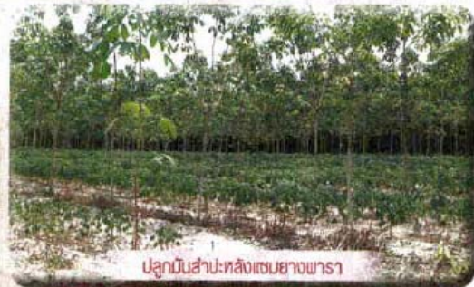
ปลูกมันสำปะหลังแซมยางพารา

ทั้งนี้สวนยางพาราของจังหวัดสงขลาไม่มีพื้นที่ปลูก (ข้อมูลปี 2557) จำนวน 2,066,960 ไร่ พื้นที่กรีดยาง 1,665,037 ไร่ ผลผลิตรวมทั้งจังหวัดมีปริมาณ 501,008 ตัน และมีผลผลิตต่อไร่ 290 กก./ไร่ ผลการศึกษาพบว่า เกษตรกรได้ปรับตัวเพื่อการอยู่รอดในสถานการณ์วิกฤติราคายางพาราตกต่ำใน 4 ด้าน