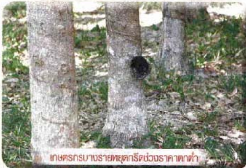
เกษตรกรบางรายหยุดกรีดยางพาราตกต่ำ