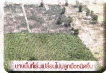
บางพื้นที่เริ่มเปลี่ยนไปปลูกพืชชนิดอื่น