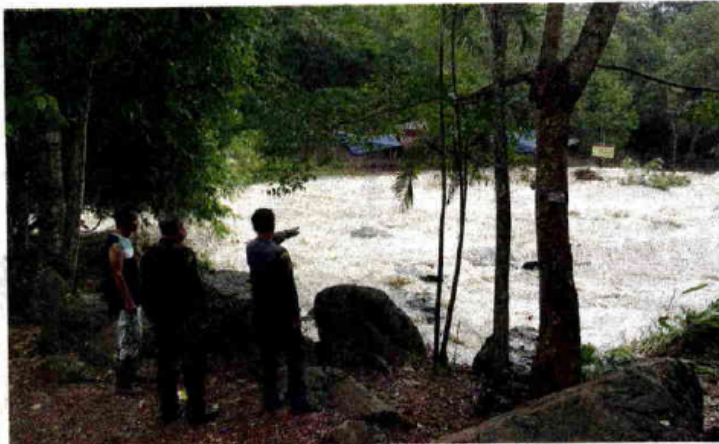
น้ำป่า - สภาพน้ำป่าจากป่าพวนพรวัว-แก่งโก ไหลเชี่ยวกรากลงน้ำตกธารทอง ต.ผาตั้ง อ.สังขม จ.หนองคาย พัดพาต้นไม้ใหญ่เล็กและทำให้ถนนเสียหายหนัก เจ้าหน้าที่คุมเข้มห้ามนักท่องเที่ยวลงเล่น น้ำอย่างเด็ดขาด เมื่อวันที่ 23 กันยายน

‘เกษตร’จับมือ‘มท.’ ส่องพื้นที่เสี่ยงแล้ง ทำนาปรังให้ลุ่มเอง ‘สมคิด’มอบนโยบาย ฐ.ก.ส. ช่วยเกษตรกร ก.เกษตรฯตั้ง วอร์รูมสู้ภัยแล้ง (อ่านต่อหน้า 12)