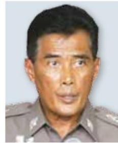
พล.ต.ท.อำนาจ นิมมะโน