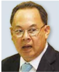
กษัต ภิรมย์