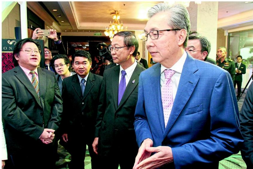
Mr Somkid (right) visits an exhibition to mark Thailand Innovation Day yesterday. He floated a new scheme to pay rice farmers to plant other crops. TAWATCHAI KEMGUMNERD

Mr Somkid said the government was also committed to going ahead with the agricultural zoning scheme, saying it will persuade more rice farmers to grow