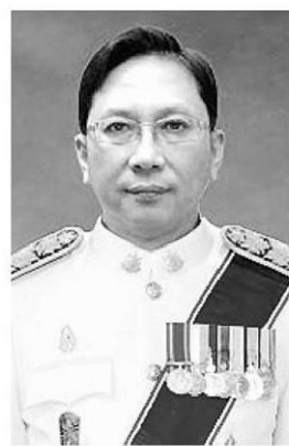
ชวลิต สุรัสวดี

ครบ 1 รอบ ในวันที่ 15 ตุลาคม 2558 ณ เขตรักษาพันธุ์สัตว์ป่าซับลังกา อ.ลำสนธิ จ.ลพบุรี โดยเตรียมการจัดหาช้างไว้ทรงปล่อย รวม 6 ตัว และสัตว์ป่าจำนวน 11 ชนิด รวม 461 ตัว... ● พล.อ.สุรศักดิ์ กาญจนรัตน์ รว.ทส. ร่วมงานวันคล้ายวันสถาปนากกระทรวงทรัพย์สินทางปัญญาและสิ่งแวดล้อม ครบรอบ 13 ปี ณ บริเวณหน้าอาคารกรมควบคุมมลพิษ และห้องประชุมศักดิ์สิทธิ์ ตรีเดช (ห้องประชุมใหญ่) ชั้น 2 อาคารกรมควบคุมมลพิษ กระทรวงทรัพย์สินทางปัญญาและสิ่งแวดล้อม ทั้งนี้ นายจตุพร บุรุษพัฒน์ อธิบดีกรมทรัพยากรน้ำ พร้อมด้วยผู้บริหารและข้าราชการจากหน่วยงานสังกัดกระทรวงทรัพย์สินทางปัญญาและสิ่งแวดล้อมร่วมงานดังกล่าว โดยภายในงานมีกิจกรรมต่างๆ... ● ขอแสดงความยินดี เก้าไปใหม่มา ท่านชวลิต สุรัสวดี อธิบดีกรมทรัพยากรทางทะเลและชายฝั่ง มานั่งเป็นท่านอธิบดีกรมป่าไม้ งานการที่ดังค้างก็จะ