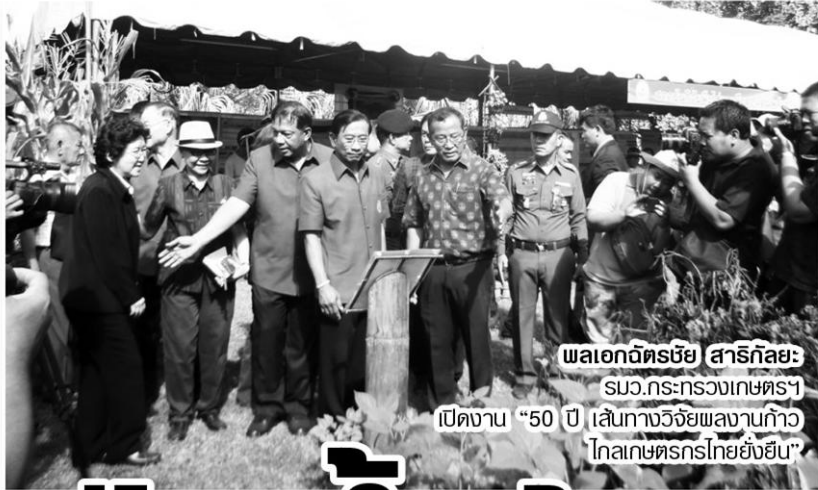
พลเอกฉัตรชัย สาริกัลยะ สมว.กระทรวงเกษตรฯ เปิดงาน “50 ปี เส้นทางวิจัยผลงานก้าว ไกลเกษตรกรไทยยั่งยืน”