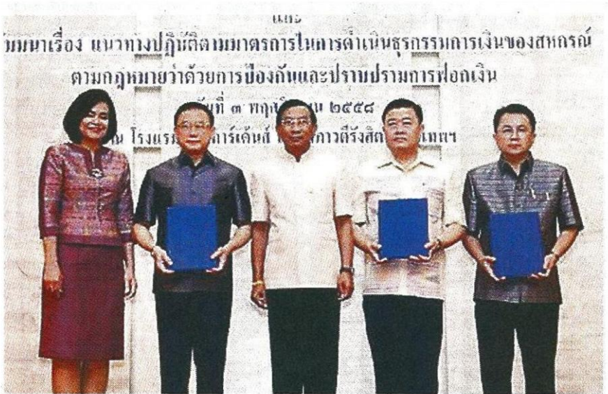
พล.อ.ฉัตรชัย สาริกัลยะ (กลาง) เป็นสักขีพยานในการลงนามข้อตกลงป้องกันการทุจริตร่วมกันของ 3 หน่วยงาน

ทั้งนี้ เนื่องจากสหกรณ์มีการทำธุรกรรมทางการเงิน จำเป็นต้องมีการดำเนินการอย่างโปร่งใสทั้งเรื่องการบันทึกบัญชี การตรวจสอบสถานะภาพทางการเงิน หากสหกรณ์สามารถดำเนินการได้อย่างมีประสิทธิภาพก็จะสามารถยกระดับมาตรฐานสหกรณ์ได้ ซึ่งเป็นเป้าหมายสำคัญอย่างหนึ่งของกระทรวงเกษตรฯ ที่จะส่งเสริมให้ระบบสหกรณ์มีความเป็นมาตรฐานและเข้มแข็งขึ้นภายในปี 2559 นี้