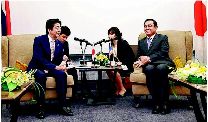
ถกญี่ปุ่น - พล.อ.ประยุทธ์ จันทร์โอชา นายกรัฐมนตรี ทหารเรือทวิภาคีกับนายชินโซะ อาเบะ นายกรัฐมนตรีญี่ปุ่น ระหว่างเดินทางร่วมประชุมสุดยอดอาเซียน ครั้งที่ 27 ณ กรุงกัวลาลัมเปอร์ ประเทศมาเลเซีย เมื่อวันที่ 20 พฤศจิกายน