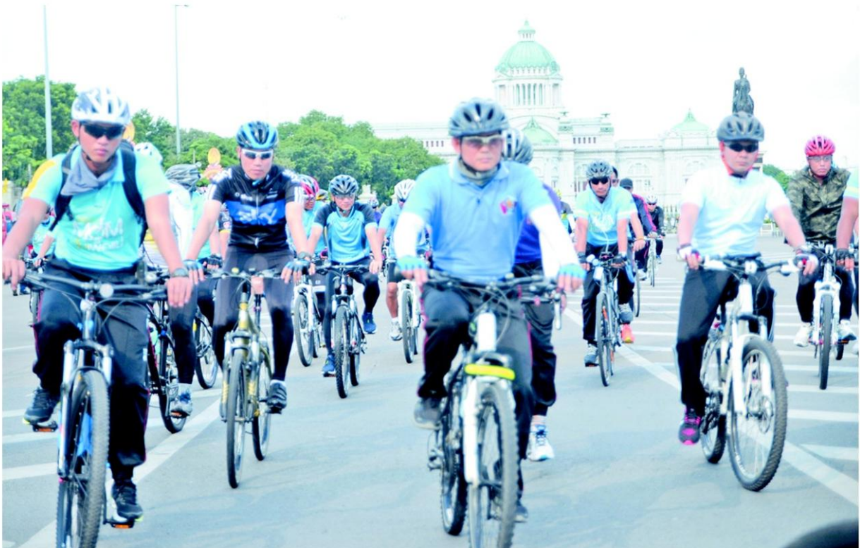
ซ้อม...พล.ต.อ.จักรทิพย์ ชัยจินดา ผู้บัญชาการตำรวจแห่งชาติ ร่วมซ้อมปั่นจักรยานเสมือนจริงการจัดกิจกรรมจักรยานเฉลิมพระเกียรติ พระบาทสมเด็จพระเจ้าอยู่หัว เนื่องในโอกาสมหามงคลเฉลิมพระชนมพรรษา 88 พรรษา 5 ธันวาคม 2558 หรือการจัดกิจกรรมปั่น จักรยาน "Bike For Dad" ที่ลานพระบรมรูปทรงม้า

นายธีรภัทร ประยูรสิทธิ ปลัด กระทรวงเกษตรและสหกรณ์ เปิดเผยว่า นอกเหนือจากการร่วมกิจกรรม ปั่นเพื่อ พ่อ ในที่ 11ธ.ค.นี้เพื่อเฉลิมพระเกียรติ พระบาทสมเด็จพระเจ้าอยู่หัว เนื่องใน โอกาสมหามงคลเฉลิมพระชนมพรรษา 88 พรรษา 5 ธ.ค. 58 ตามพระราชปณิ ธาน สมเด็จพระบรมโอรสาธิราชฯ สยาม มกุฎราชกุมาร แล้ว ระหว่างวันที่ 11-13