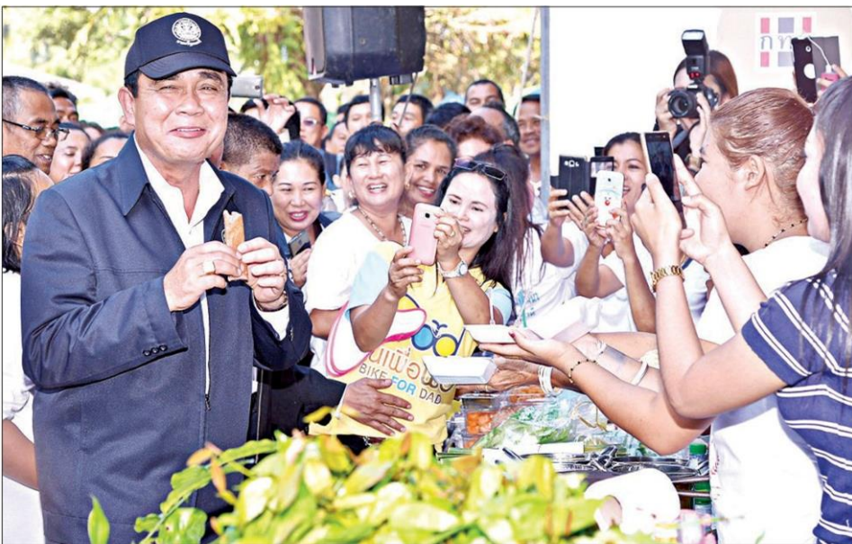
▲ ลงภาคใต้...พล.อ.ประยุทธ์ จันทร์โอชา นายกฯ นำคณะเดินทางลงพื้นที่ อ.บ้านนาเดิม จ.สุราษฎร์ธานี เยี่ยมชมการปลูกกล้วยหอมทองในสวนยางพารา หลังจากนั้นเดินทางไปที่โรงเรียนบ้าน หนองเรียน อ.บ้านนาเดิม มีประชาชนที่สนับสนุนส่งเสียงเชียร์ให้เป็นนายกฯ ยาว 10 ปี

ผู้สื่อข่าวรายงานว่า ในระหว่างที่ พล.อ. ประยุทธ์ ได้พบปะประชาชนที่มาให้การ ต้อนรับ ในช่วงหนึ่งประชาชนได้วยพรให้ พล.อ.ประยุทธ์ เป็นนายกฯ ต่อไปอีก 10 ปี ขณะที่ พล.อ.ประยุทธ์ ยิ้มแล้วกล่าวตอบว่า “หนังสือพิมพ์ลงแล้ว ไม่ใช่หรือว่าใครเป็น นายกฯ คนต่อไป หมอคู่มือที่กัทำนายแล้วว่าใคร