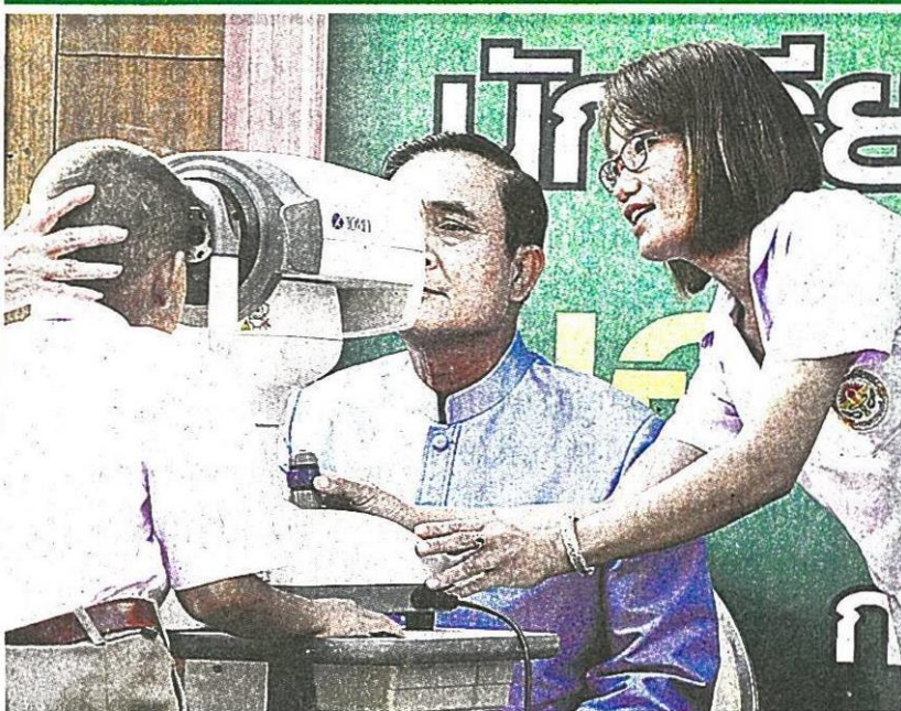
▲ สายตายาว พล.อ.ประยุทธ์ จันทร์โอชา นายกรัฐมนตรี ตรวจเช็คสายตาโดยแพทย์จากสถาบันสุขภาพเด็กแห่งชาติมหาราชินี และโรงพยาบาลวัดไร่ขิง พบว่าข้างซ้ายยาว 100 ส่วนข้างขวายาว 250 ก่อนร่วมประชุม ครม.ที่ทำเนียบรัฐบาล.

ปฏิทินคู่ดูโอ "แม่-ปู" แจกกระจายช่วงปีใหม่ บานไม่หุบ "บิกตู" ไม่ปลื้ม ตวาดลั่นมันสมควร ใหม่ คนทำผิด ก.ม.มาแจกปฏิทิน ★ มีต่อหน้า 6