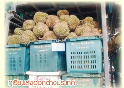
ทุเรียนส่งออกต่างประเทศ

โดย ทุเรียน จะเริ่มออกผลผลิตในเดือนมีนาคม และออกมากในเดือนพฤษภาคม 2559 เงาะ จะเริ่มออกสู่ตลาดตั้งแต่เดือนเมษายน และออกมากในเดือนมิถุนายน 2559 ซึ่งจะแตกต่างจาก