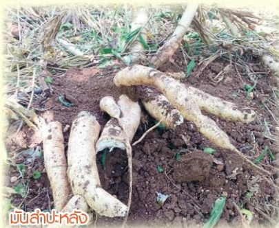
ปีปลูกหลัง

ผลผลิตทุเรียน เงาะ มังคุด ลองกอง จะเพิ่มขึ้นทุกชนิด ซึ่งปริมาณผลผลิตโดยรวมอยู่ที่ 803,203 ตัน เพิ่มขึ้นจากปีที่แล้วประมาณร้อยละ 12 โดยผลผลิตจะเริ่มออกสู่ตลาดตั้งแต่ปลายเดือนกุมภาพันธ์ 2559