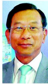
พล.อ.ฉัตรชัย สาริกัลยะ

ระหว่างที่เดินไปนั้น เหมือนทันเหลือบเห็นหรือพอกระเซ้าปีใหม่สีสันสดใสที่วางอยู่ใกล้ๆ จึง