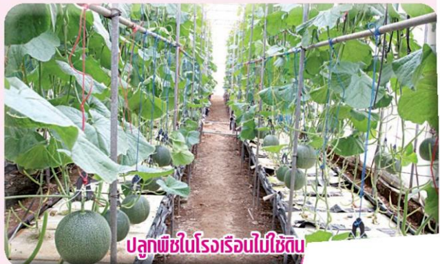
ปลูกพืชในโรงเรือนไม่ใช้ดิน

สาธารณรัฐฝรั่งเศส เพื่อหารือให้ได้ผลลัพธ์ในรูปแบบของพิธีสารหรือข้อตกลงใหม่ว่าด้วยความร่วมมือภายใต้อนุสัญญาฯ ซึ่งจะผลบังคับใช้กับทุกประเทศภาคีภายในปี ค.ศ. 2020