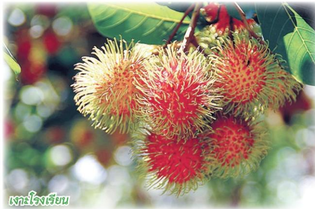
เงาะโรงเรียน

เพื่อใช้ประกอบการวางแผนบริหารจัดการตั้งแต่ต้นฤดูกาล โดยคณะทำงานสำรวจข้อมูลไม้ผลเศรษฐกิจภาคตะวันออก ได้พยากรณ์ผลผลิตไม้ผลภาคตะวันออก ครั้งที่ 1 ของสินค้า 4 ชนิด ได้แก่ ทุเรียน เงาะ มังคุด และลองกอง ในพื้นที่ 3 จังหวัด ได้แก่ จันทบุรี ระยอง และตราด ซึ่งเป็นแหล่งผลิตสำคัญของ