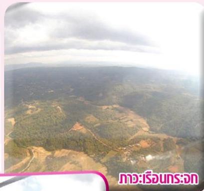
ภาวะเรือนกระจก

นอกจากนี้ ยังมีการประชุมองค์การย่อย ว่าด้วยวิทยาศาสตร์และเทคโนโลยี สมัยที่ 43 โดยมีการเจรจาประเด็นที่เกี่ยวข้องกับภาค เกษตรในรูปแบบการประชุมเชิงปฏิบัติการ เช่น ประเด็นการบังคับมาตรฐานการปรับตัว โดย พิจารณาความหลากหลายของระบบการเกษตร ระบบความรู้ดั้งเดิม ระดับความแตกต่างของ แต่ละประเทศ และการแลกเปลี่ยน ประสบการณ์ในการวิจัยและพัฒนา และ ประเด็นการบังคับประเมินแนวทางปฏิบัติและ เทคโนโลยีด้านการเกษตร ต่อการเพิ่ม