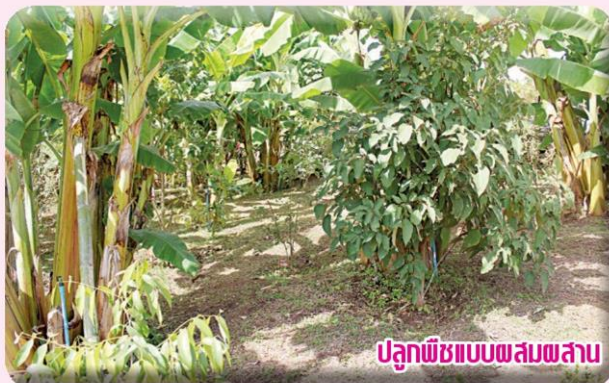
ปลูกพืชแบบผสมผสาน