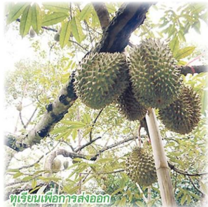
ทุเรียนเพื่อการส่งออก