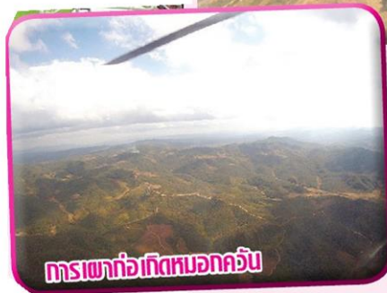
การเผาถ่านเกิดหมอกควัน

ประสิทธิภาพการ ผลิตอย่างยั่งยืน ความมั่นคงอาหาร และการมีภูมิคุ้มกัน ทั้งนี้ผู้แทน จากประเทศไทยจะ ได้ร่วมกับหน่วย