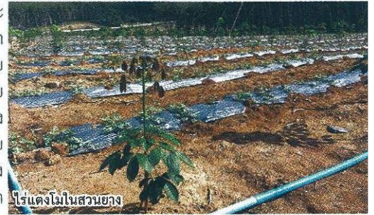
โปรแดงโมโนสวนยาง

นั้น หลายภาคส่วนต่างสนับสนุนเป็นอย่างดี จะเห็นได้จากในวงเสวนาโต๊ะกลม เรื่อง “พลิกวิกฤตเป็นโอกาสแก้ปัญหายางพารา” จัดโดยสมาคมสื่อมวลชนเกษตรแห่งประเทศไทย ร่วมกับมหาวิทยาลัยเกษตรศาสตร์ ณ ห้องประชุม อาคารสารนิเทศ 50 ปี มหาวิทยาลัยเกษตรศาสตร์ เมื่อปลายสัปดาห์ที่ผ่านมา ต่างเห็นด้วยเป็นอย่างยิ่งที่จะให้มีการส่งเสริมปลูกพืชเศรษฐกิจแซมในสวนยางพารา เพื่อเพิ่มรายได้ให้แก่เกษตรกร