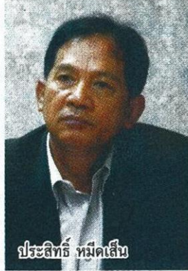
ประสิทธิ์ หมดเสน