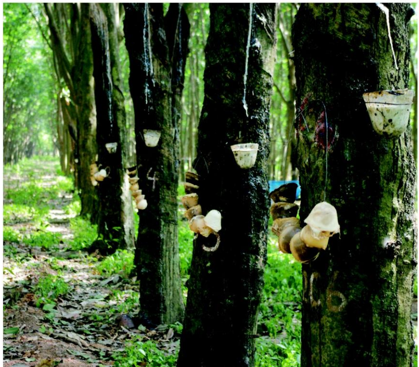
อาชีพเสริม - ชาวสวนยาง จ.บึงกาฬจะทำยางก้อนถ้วย 5-6 ครั้งจึงมาเก็บไปขายให้พ่อค้า เพื่อจะได้มีเวลาไปทำอาชีพเสริมอย่างอื่นรับมือยางราคาตกต่ำ และไม่ต้องจ้างแรงงานนอกครอบครัวมากนัก ทำให้ลดต้นทุนไปได้มาก

ปัญหาผู้ประกอบการไม่สามารถใช้เงินไปจากธนาคารออมสินได้ ทางกระทรวงจึงต้องดำเนินการร่วมกับธนาคารพาณิชย์ เพื่อแก้ไขเงินไปและลดขั้นตอนให้เร็วขึ้น อีกมาตรการหนึ่ง คือ สนับสนุนสินเชื่อเงินทุนผู้ประกอบการวงเงิน 10,000 ล้านบาท ส่วนปลายทางการสนับสนุนเงินทุนหมุนเวียน ชดเชยดอกเบี้ยเงินกู้ให้กับสหกรณ์ วงเงิน 1 ล้านบาท ซึ่งกำลังดำเนินการอยู่ สหกรณ์ได้รับสินเชื่อ 370 แห่ง วงเงิน 4,500 ล้านบาท ซึ่งจะขยาย