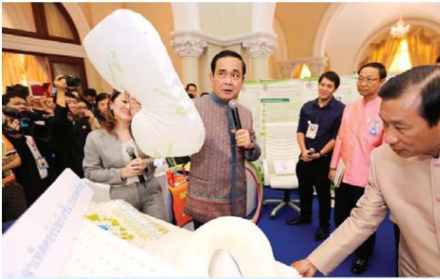
■ ทำจากยาง ■ พล.อ.ประยุทธ์ จันทร์โอชา นายกรัฐมนตรี เยี่ยมชม การจัดแสดงผลิตภัณฑ์และการใช้ประโยชน์จากยางพารา ที่ทำเนียบ รัฐบาล เมื่อวันที่ 19 ม.ค.