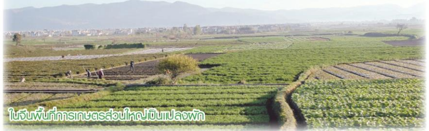
ในจีนพื้นที่การเกษตรส่วนใหญ่เป็นแปลงพัก

ในกรณีที่เกิดปัญหาศัตรูพืช ผู้ส่งออกและผู้ประกอบการผลิตข้าวส่งออกไปจีนจะต้องขึ้นทะเบียนกับกระทรวงเกษตรและสหกรณ์ไทย