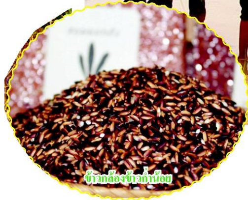
ข้าวกล้องที่อกน้อย

แดดที่ร้อน นาก็แฉ่ง ส่งผลกระทบต่อไปทั่วทุกหัวระแหง โดยเฉพาะนาข้าว สอดคล้องกับสถิติผลผลิตที่สำนักงานเศรษฐกิจการเกษตรรวบรวมข้อมูลไว้แต่ละปี