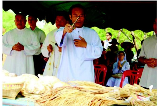
ทำพิธีพรมน้ำมนต์ข้าว

แรกเริ่มหันมาหาแนวทางอินทรีย์ สมัยบอกว่าแม่แต่สามมีก็หัวเราะเยาะ ไม่เชื่อว่าจะไปรอด พอพิสูจน์มาได้ 2 ปี มีเหลือกินและเหลือขาย สามมีเปลี่ยนใจมาช่วยเต็มตัว