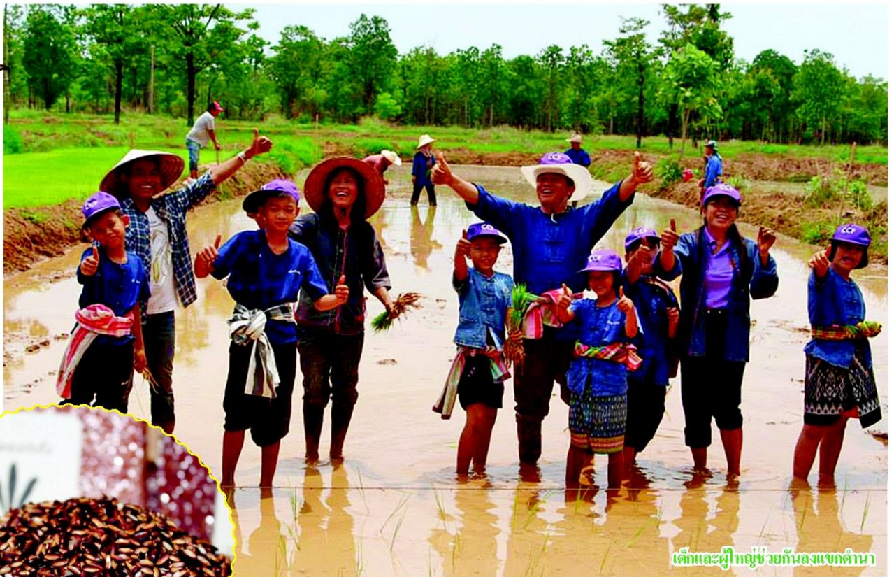
เด็กและผู้ใหญ่ช่วยกันลงแขกดำนา