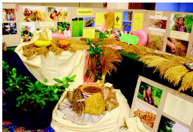
ออกงานแสดงผลภัณฑ์

ถึง 1 กระสอบ เดี่ยวนี้ใช้แค่ 2 กิโลกรัม และต้นกล้าข้าวก็ไม่สิ้นเวลาออกรวงที่ได้ขนาดเสมอกัน