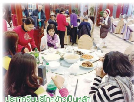
ประเทศจีนบริโภคข้าวเป็นหลัก

และสหกรณ์ไทยรับทราบเพื่อดำเนินการสืบสวนสาเหตุปัญหาและมาตรการแก้ไขทันที หากมีการตรวจพบปัญหาสินค้าข้าวไม่เป็นไปตามข้อกำหนดบ่อยครั้ง ฝ่ายจีนก็จะเดินทางมาตรวจสอบระบบควบคุมสุขอนามัยและสุขอนามัยพืชของข้าวของไทย โดยฝ่ายไทยจะต้องเป็นผู้รับผิดชอบค่าใช้จ่าย ทั้งนี้ข้าวที่ทางการไทยได้ลงนามกับประเทศจีนนั้น ในเบื้องต้นมีจำนวน 2 ล้านตัน โดยอยู่ภายใต้กรอบการซื้อขาย ในปี 2559 นี้เบื้องต้นจีนต้องการข้าวขาว 5% แบ่งเป็นข้าวฤดูกาลใหม่ 1 ล้านตัน และข้าวเก่า 1 ล้านตันส่วนราคาจะยึดราคาตลาดเป็นหลัก.