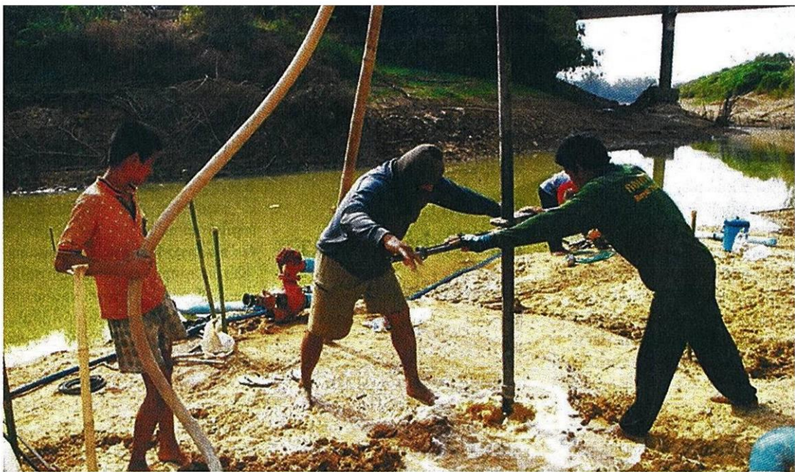
ผู้แล้ง : ชาวนา อ.บางระกำ จ.พิษณุโลก ลงทุนขุดบ่อบาดาลกลางแม่น้ำยม ที่แก่งขอด เพื่อดึงน้ำใต้ดินขึ้นมาใช้หล่อเลี้ยงนาข้าว และใช้ทางการเกษตร