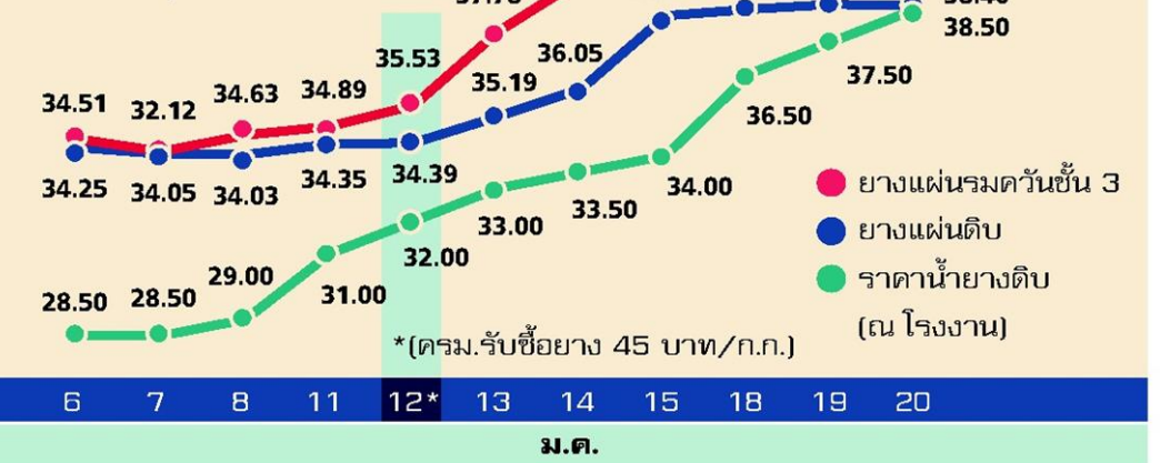
ที่มา : การยางแห่งประเทศไทย (กยท.) ข้อมูล ณ วันที่ 20 ม.ค.2559