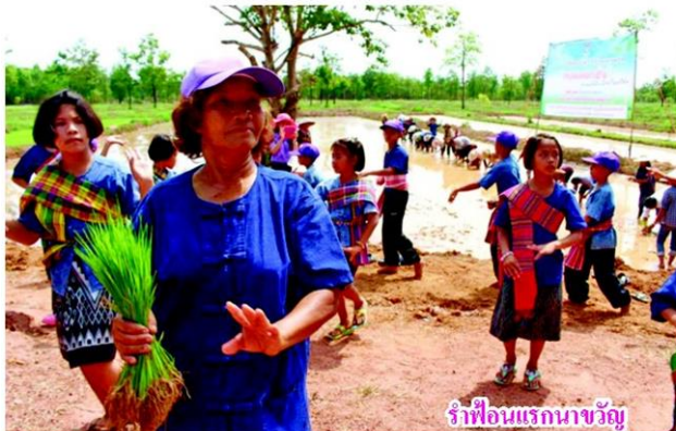
จำที่อินแรกนาขวัญ

หลังจากเกี่ยวข้าวเสร็จแล้ว ก็ลงข้าวโพดกับฟักทอง เพื่อปรับสภาพดิน ระหว่างที่รอผลผลิตก็เอาข้าวไปใส่ที่โรงสีชุมชน คัดกระสอบละ 20 บาท จะไม่สีที่ละมกๆ เพราะไม่อยากจะเก็บไว้นานจนเสียคุณภาพ เวลาบรรจุข้าวลงถุงขายจะคัดเมล็ดที่ไม่หัก ไม่แตก ไม่อยากมั่งก่ายกับคนซื้อ