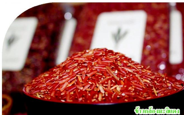
ข้าวกล้องงาชนิดแดง