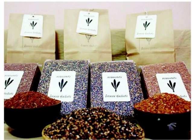
แพ็คเกจผลิตภัณฑ์ข้าวต่างๆ ของข้าวหอมดอกฮัง

“ถ้าเราอยากกินข้าวที่ปลอดภัย ก็ต้องเข้าใจกระบวนการผลิต และต้องมีความซื่อสัตย์กับตัวเอง ลองคิดกลับกันถ้าเราไปซื้อกิน เราก็ไม่อยากจะถูกหลอก เพราะฉะนั้นในฐานะชาวนา ต้องไม่หลอกหลวงผู้บริโภค พอมีความจริงใจ ทำนากลางแดดแรงแค่ไหนก็ไม่เหนื่อย จึงมีคติประจำใจว่ากินอินม นอนอิน ทุนมี หนี้หมด” ป้าสมัยย้ำ