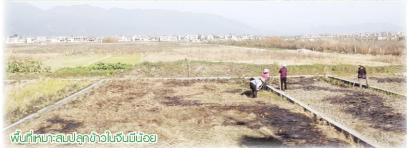
พื้นที่เหมาะสมปลูกข้าวในจีนมีน้อย

ตลอดถึงผู้สินค้าต้องได้รับการตรวจสอบให้ปลอดภัยจากศัตรูพืชและรмышข้าวก่อนส่งออกทุกครั้ง