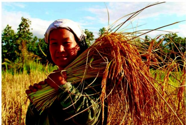
สมัย มังคะ

หัวข้อข่าว: วิถีข้าว-เกษตรอินทรีย์'หอมดอกอภัย'สกลนคร