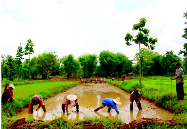
ลงแขกดำนา

หัวข้อข่าว: วิถีข้าว-เกษตรอินทรีย์'หอมดอกฮัง'สกลนคร