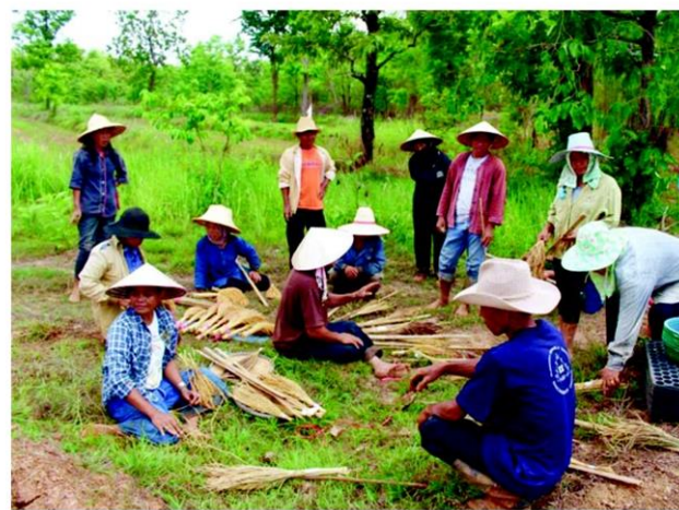
เก็บเกี่ยวและคัดแยกเมล็ดพันธุ์

ถึ สำหรับผลิตภัณฑ์ข้าวที่กลุ่มวิสาหกิจชุมชนข้าวหอมดอกอภัยนำเสนอขณะนี้ได้แก่ “ข้าวกล้องข้าวก้าน้อย” เป็นข้าวเหนียวที่เมล็ดมีสีดำปนขาว เมื่อหุงหรือหนึ่งตุก จะได้เมล็ดสีม่วงเข้มจนเป็นสีดำนิตตลอดเมล็ด เหนียวนุ่ม มีกลิ่นหอม