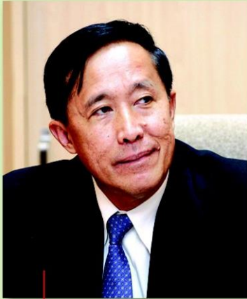
พล.อ. ฉัตรเฉลิม เฉลิมสุข

ชาวสวนยาง 1.5 ล้านครัวเรือนไม่มีเอกสารสิทธิได้เฮ หลัง “ฉัตรเฉลิม” ประธานบอร์ด กยท. นั่งหัวโต๊ะไฟเขียวให้ขึ้นทะเบียนได้ แถมยังใจป้ำให้ 9