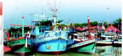
ที่มา : สมาคมการประมงแห่งประเทศไทย ณ วันที่ 21 มีนาคม 2559

บริษัทผู้ผลิตสินค้าประมงรายใหญ่ อาทิ บมจ. ไทยยูเนี่ยน โฟรเซ่น โปรดักส์ และ บมจ. เจริญโภคภัณฑ์อาหาร หรือ ซีพีเอฟ เป็นต้น"