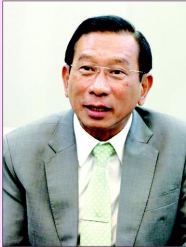
●พล.อ.ฉัตรชัย สาริกัลยะ:

ทั้งนี้กรรมการผู้ทรงคุณวุฒิจะมีอำนาจหน้าที่ ได้แก่ 1. เสนอแผนการพัฒนาระบบเกษตรพันธะสัญญาที่เป็นธรรมต่อคณะรัฐมนตรี (ครม.) เพื่อพิจารณาอนุมัติ 2. เสนอรูปแบบเกษตรพันธะสัญญาที่เป็นธรรมเพื่อนำไปปฏิบัติ 3. เสนอแนะต่อหน่วยงานของรัฐที่เกี่ยวข้องให้มีการตรากฎหมายหรือแก้ไขเพิ่มเติมกฎหมาย กฎระเบียบ ข้อบังคับเกี่ยวกับการส่งเสริมและพัฒนาระบบเกษตรพันธะสัญญา 4. ติดตาม ประสานงาน หรือเร่งรัดการดำเนินงานของหน่วยงานของรัฐ