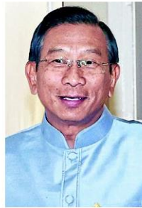
พล.อ.ฉัตรชัย

พล.อ.ฉัตรชัย ยังระบุว่า ผลจากการปรับเปลี่ยนระบบการจัดซื้อจัดจ้างจากเดิมที่ใช้ระเบียบสำนักนายกรัฐมนตรีว่าด้วยการพัสดุ พ.ศ. 2535 มาเป็นการจัดหาพัสดุด้วยวิธีตลาดอิเล็กทรอนิกส์ (e-market) และด้วยวิธีประกวดราคาอิเล็กทรอนิกส์ (e-bidding) ส่งผลให้กระทรวงเกษตรฯ ประหยัดงบประมาณการจัดจ้างเป็นจำนวนมาก โดยเฉพาะกรมชลประทานที่ลดงบจัดซื้อจัดจ้างได้ 1.39 หมื่นล้านบาท ในช่วงปีงบ 2557-2559 ทั้งนี้ ในปีงบ 2557 พบว่ากรมชลประทานจัดซื้อจัดจ้างงานลงทุนด้วยระบบ e-bidding และลดงบจัดซื้อได้ 3,300 ล้าน