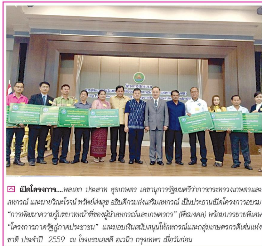
☒ เปิดโครงการ....พลเอก ประสาท สุขเกษตร เลขานุการรัฐมนตรีว่าการกระทรวงเกษตรและสหกรณ์ และนายวิณะโรจน์ ทรัพย์ส่งสุข อธิบดีกรมส่งเสริมสหกรณ์ เป็นประธานเปิดโครงการอบรม “การพัฒนาความรู้บทบาทหน้าที่ของผู้นำสหกรณ์และเกษตรกร” (พีชมงคล) พร้อมบรรยายพิเศษ “โครงการภาครัฐสู่ภาคประชาชน” และมอบเงินสนับสนุนให้สหกรณ์และกลุ่มเกษตรกรดีเด่นแห่งชาติ ประจำปี 2559 ณ โรงแรมเอสดี อเวนิว กรุงเทพฯ เมื่อวันก่อน