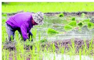
ชงครม.เต็มเงิน