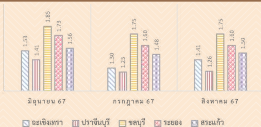
ภาพที่ 2 แสดงราคามันสำปะหลังสดคละเฉลี่ยที่เกษตรกรขายได้ เดือน มิ.ย. 67 - ส.ค. 67 (หน่วย:บาท/กก.)

ราคาหัวมันสำปะหลังสดคละ ที่เกษตรกรขายได้ ณ ไร่นา เดือนสิงหาคม 2567 จังหวัดฉะเชิงเทรา ราคาเฉลี่ย 1.41 บาท/กก. ปรับตัวเพิ่มขึ้นจากเดือนที่ผ่านมาร้อยละ 8.46 จังหวัดปราจีนบุรี ราคาเฉลี่ย 1.26 บาท/กก. ปรับตัวเพิ่มขึ้นจากเดือนที่ผ่านมาร้อยละ 0.80 จังหวัดชลบุรี ราคาเฉลี่ย 1.75 บาท/กก. ทรงตัวจากเดือนที่ผ่านมา จังหวัดระยอง ราคาเฉลี่ย 1.60 บาท/กก. ทรงตัวจากเดือนที่ผ่านมา จังหวัดสระแก้ว ราคาเฉลี่ย 1.50 บาท/กก. ปรับเพิ่มขึ้นจากเดือนที่ผ่านมาร้อยละ 1.35 สถานการณ์ทั่วไปในภาคตะวันออก เดือนสิงหาคม 67 โดยภาพรวมราคาคงที่ และปรับเพิ่มขึ้นเล็กน้อย เนื่องจากเป็นช่วงปลายฤดูการเก็บเกี่ยว ผลผลิตออกสู่ตลาดน้อย ราคาที่เกษตรกรได้รับเป็นไปตามความต้องการของผู้ประกอบการ และคุณภาพของผลผลิต และโดยภาพรวมแสดงราคาเปรียบเทียบเดือน มิถุนายน 2567 - สิงหาคม 2567 รายละเอียดดังภาพที่ 2