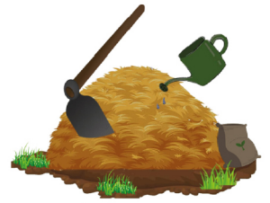
นำไปใส่กระบวนกร