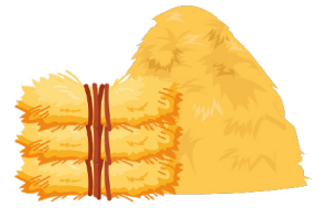
ฟางข้าวที่เหลือใช้