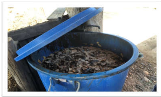
ภาพที่ 3.2 ลักษณะของคอกผลิตปุ๋ยอินทรีย์จากฟางข้าว