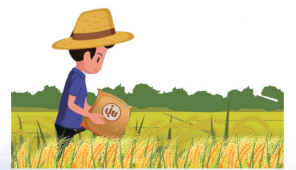
ทูนไม้บ้าน ข้าวรวงโต