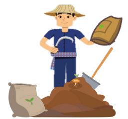
หมักไว้เพียงไม่นาน