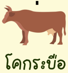
โคกระบือ