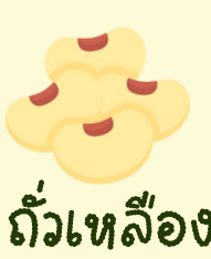
ถั่วเหลือง