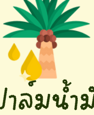
ปาล์มน้ำมัน