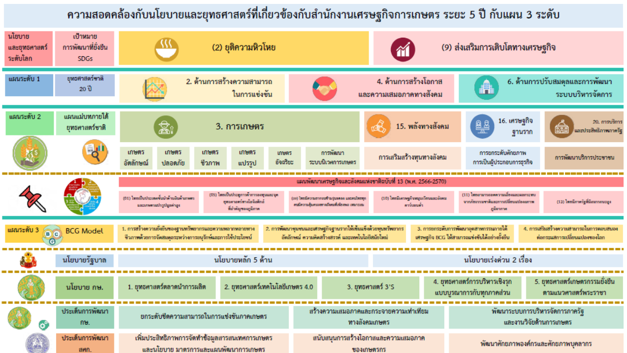
ภาพที่ 1.1 ความสอดคล้องกับนโยบายและยุทธศาสตร์ที่เกี่ยวข้องกับสำนักงานเศรษฐกิจการเกษตร

ดังนั้น เพื่อให้การดำเนินงานของสำนักงานเศรษฐกิจการเกษตรที่ 3 สอดรับกับแผนปฏิบัติราชการของสำนักงานเศรษฐกิจการเกษตร 20 ปี แผนระยะ 5 ปี รวมทั้งวิสัยทัศน์ของสำนักงานเศรษฐกิจการเกษตร คือ “องค์กรนำในการพัฒนาภาคเกษตรและศูนย์กลางสารสนเทศการเกษตรแห่งชาติที่มีประสิทธิภาพสูง ภายในปี 2570” จึงได้จัดทำแผนพัฒนาสำนักงานเศรษฐกิจการเกษตรที่ 3 อุดรธานี ระยะ 5 ปี (พ.ศ.2566 – 2570) (ภาพที่ 1)