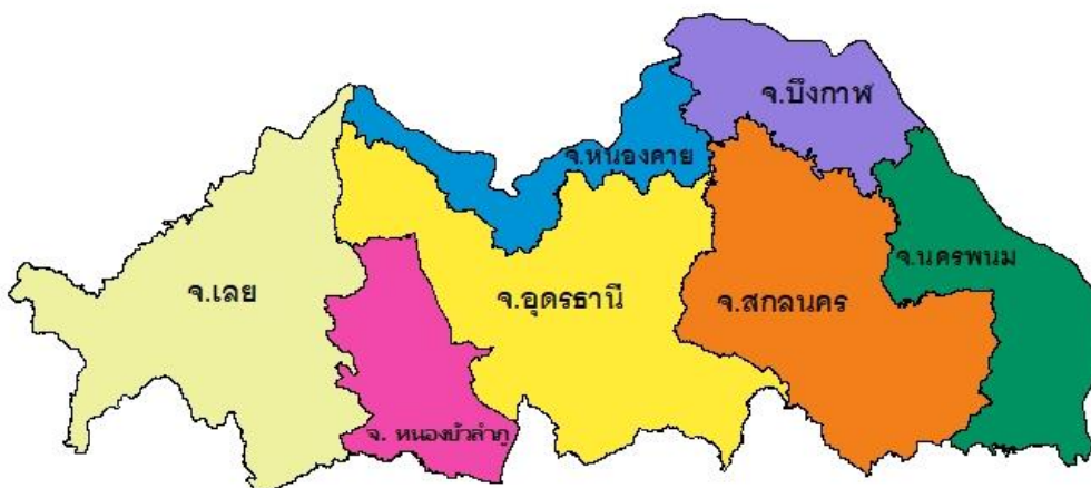
ภาพที่ 2.1 พื้นที่รับผิดชอบของสำนักงานเศรษฐกิจการเกษตรที่ 3

ต่อมาเมื่อปี 2530 ได้มีการจัดแบ่งพื้นที่เขตเกษตรเศรษฐกิจเพิ่มขึ้นเป็นหน่วยงานราชการ 24 แห่ง ทำหน้าที่เปรียบเสมือน "ตัวแทน" ของสำนักงานเศรษฐกิจการเกษตรที่ไปจัดตั้งในส่วนภูมิภาค มีสถานที่ทำงานเป็นการถาวรในแต่ละเขต และมีหน้าที่ความรับผิดชอบเพิ่มจากการจัดเก็บข้อมูลการเกษตร ทำหน้าที่ในการศึกษา วิเคราะห์ภาวะเศรษฐกิจการเกษตรของครัวเรือนเกษตรกรในท้องถิ่น สรุปรวติดตามประเมินผลร่วมกับส่วนกลาง ประสานแผนพัฒนาการเกษตรระดับจังหวัด และวิเคราะห์แผนพัฒนาการเกษตรตามสภาพทรัพยากรในพื้นที่ และในปี 2545 ภายใต้อุปการะการบริหารราชการแผ่นดิน กระทรวงเกษตรและสหกรณ์ ได้ออกกฎกระทรวงแบ่งส่วนราชการของสำนักงานเศรษฐกิจการเกษตร พ.ศ. 2545 มีผลบังคับใช้เมื่อวันที่ 9 ตุลาคม 2545 ให้แบ่งส่วนราชการเขตเกษตรเศรษฐกิจซึ่งเดิมมี 24 แห่ง เป็นสำนักงานเศรษฐกิจการเกษตรแห่ง 9 แห่ง ต่อมาได้มีการเพิ่มเป็น 12 แห่ง ในจำนวนนี้มีสำนักงานเศรษฐกิจการเกษตรที่ 3 ซึ่งมีพื้นที่รับผิดชอบ 7 จังหวัด คือ อุตรธานี หนองคาย บึงกาฬ หนองบัวลำภู เลย สกลนคร และนครพนม (ภาพที่ 2.1)